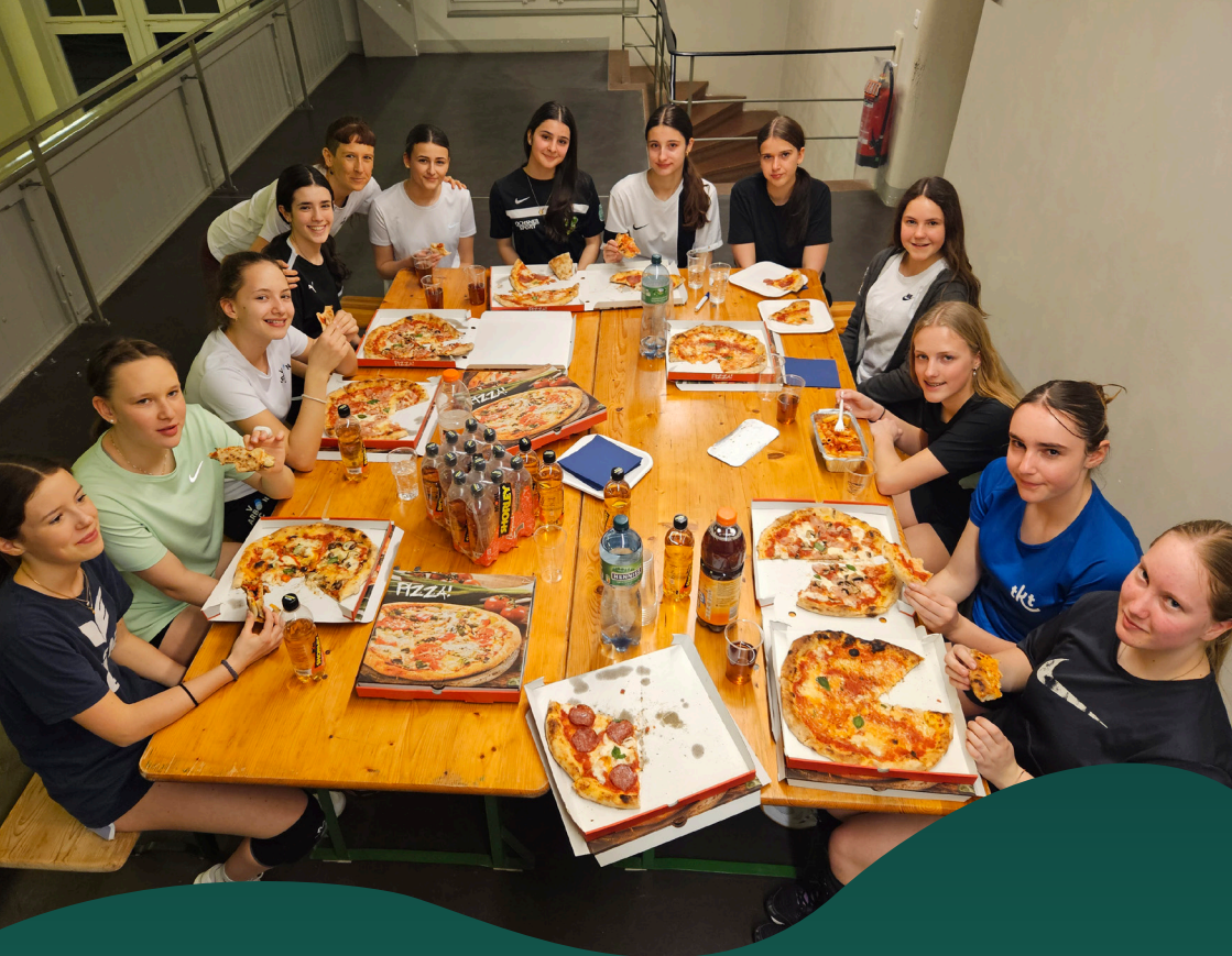
Pizzaplausch: Zum Abschluss der Saison machten wir einen Spiel- und Pizzaplausch in der Bergli-Halle.