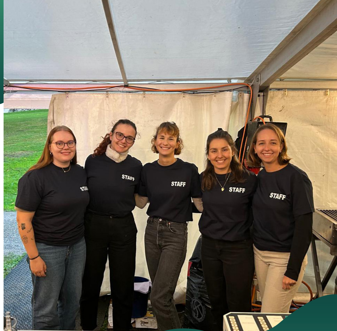
Start in die Saison mit Einsatz beim Fischerverein

Nun blicken wir gespannt auf die 3. Liga, neue Gegnerinnen und spannende Herausforderungen.